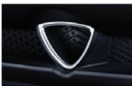
EMBLÈME DE MOTEUR ROTATIF ARRIÈRE