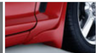
BAVETTES GARDE-BOUE AVANT