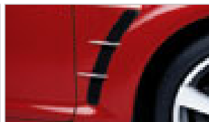
GARNITURES DE SORTIE D'AIR – ALUMINIUM (JEU DE QUATRE)