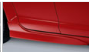
PROLONGEMENTS DE SEUILS DE PORTES (JEU DE DEUX)