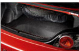
TROUSSE DE PNEU DE SECOURS