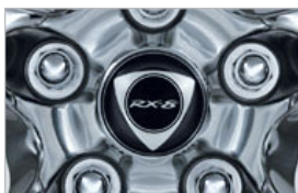
CACHE-MOYEU – NOIR, AVEC EMBLÈME DE MOTEUR ROTATIF