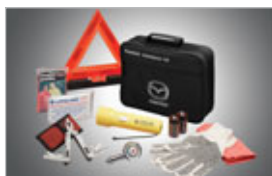
TROUSSE D'ASSISTANCE ROUTIÈRE