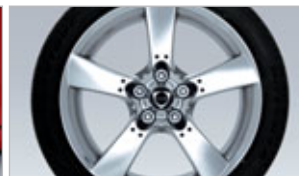
ROUES DE 18 PO EN ALUMINIUM POLI (NE COMPREND PAS LE CACHE-MOYEU AVEC EMBLÈME DE MOTEUR ROTATIF ET LE BOUCHON DE VALVE DE PNEU)