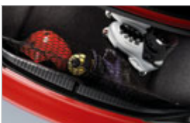
FILET À BAGAGES