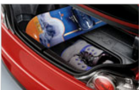
REVÊTEMENT PROTÉCTEUR POUR COFFRE