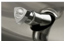
BOUCHONS DE VALVE DE PNEU AVEC EMBLÈME DE MOTEUR ROTATIF (JEU DE QUATRE)