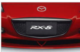
GARNITURE DE CALANDRE