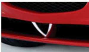
EMBLÈME DE MOTEUR ROTATIF AVANT