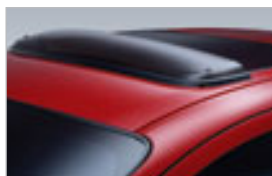
DÉFLECTEUR DE TOIT OUVRANT