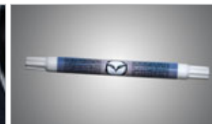
PEINTURE DE RETOUCHE EN CRAYON