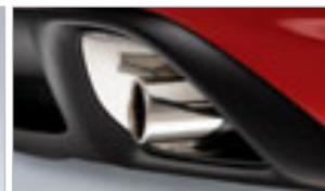
EMBOUTS D'ÉCHAPPEMENT – CHROMÉS (JEU DE DEUX)